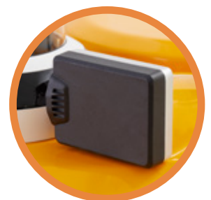
Radar de ondas milimétricas